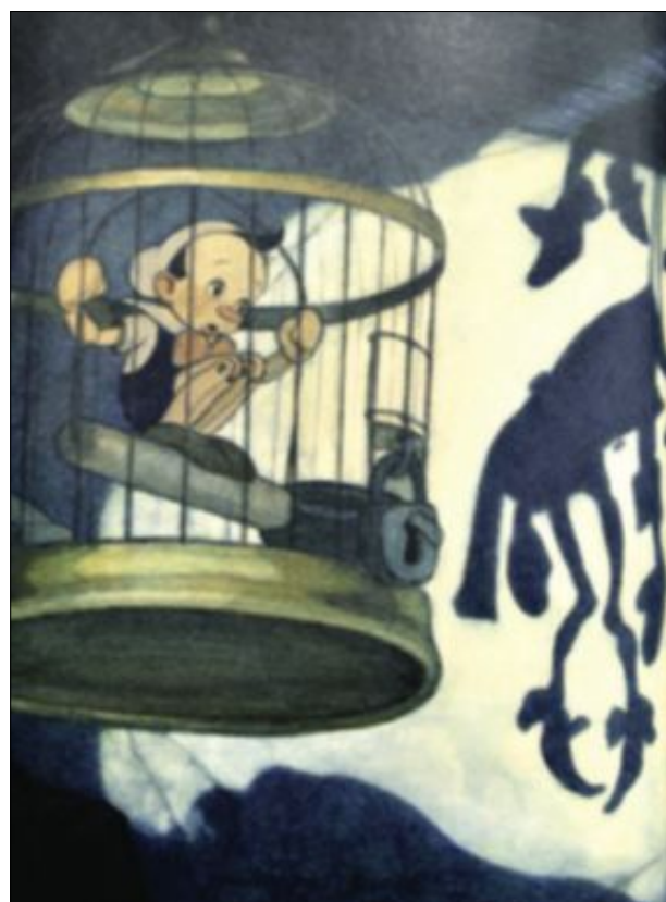
Detalj ur layoutmålning för Pinocchio som blev Disney-film.