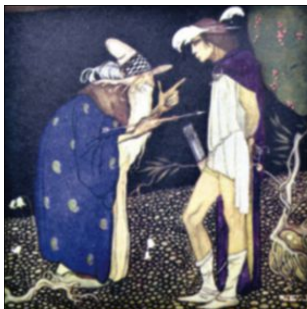
Med tydlig influens av John Bauer. Illustration av Gustaf Tenggren till Tomtar och troll 1919, året efter John Bauers död.

MEN JUST FILMEN Bambi blev början till slutet för Tenggrens anställning hos Disney. Hans illustrationer