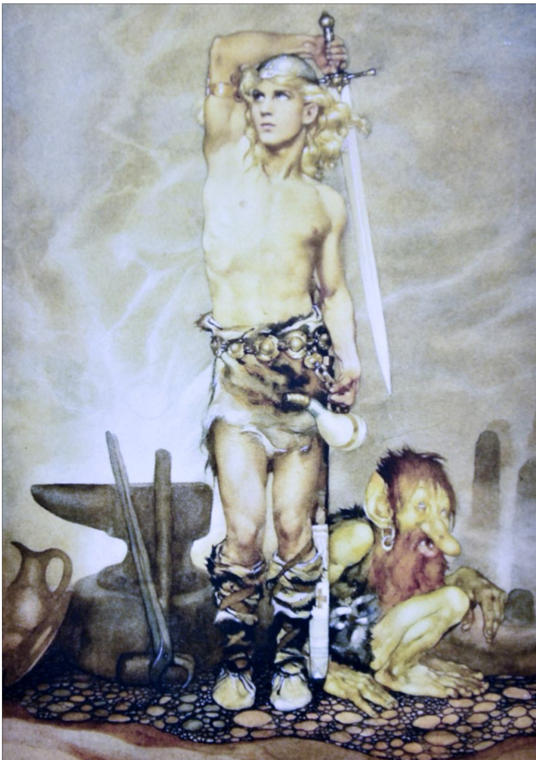
Detta verk av Gustaf Tenggren – The ring of the Nibelung (1932) såldes nyligen på Stockholms Auktionsverk och klubbades för 150 000 kronor.