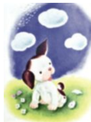
The poky little Puppy från 1942.

amerikanske popkonstnären Jim Dine, men gestaltad så som Tenggren tecknade honom 1938.