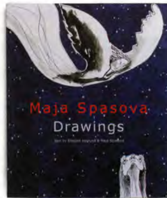
Till vänster och nedan: Maja Spasova – Drawings . Bilder av Maja Spasova. Grafisk form av Kristian Spasov. Text av Maja Spasova och Elisabet Haglund. Bokförlaget Arena, 2014.